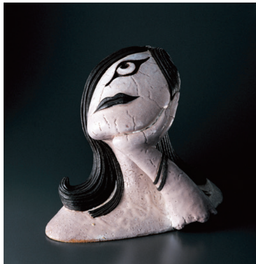
三輪休雪 〈人間〉シリーズ《女》 昭和51年(1976)