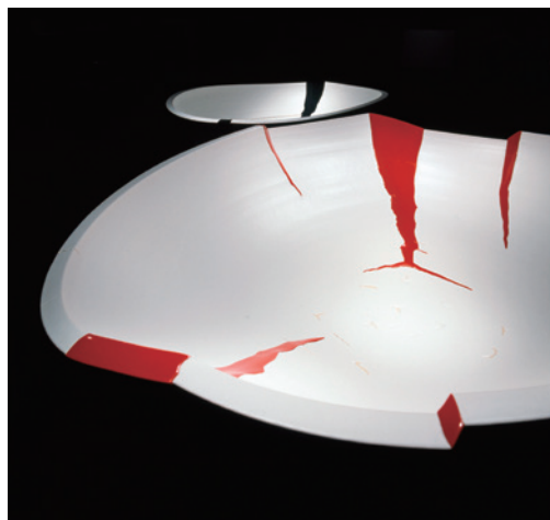
十三代 三輪休雪(三輪和彦)《阿》《叶》2006年