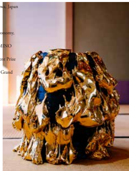
デザイン：鈴木聖 Designed by Satoshi Suzuki